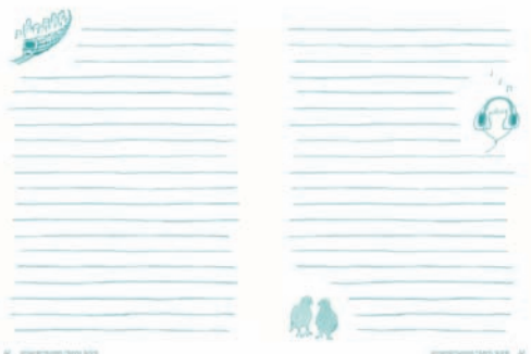
4つのフォーマットのノートを本の中に組み込み