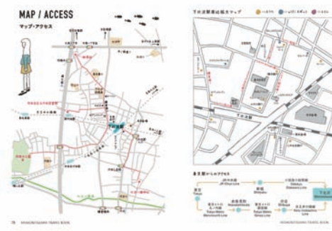
下北沢駅周辺と広域マップ付き